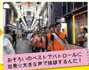
おそろいのベストでパトロールに 出発☆大きな声で挨拶するんだ!