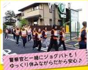
警察官と一緒にジョグバトも! ゆっくり休みながらだから安心♪