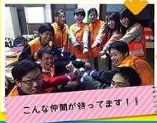
こんな仲間が待ってます!!