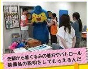
先輩から着ぐるみの着方やパトロール 装備品の説明をしてもらえるんだ