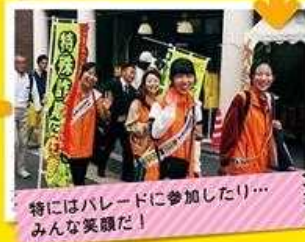
特にはパレードに参加したり... みんな笑顔だ!