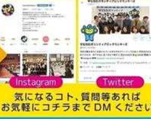
Instagram Twitter 気になるコト、質問等あれば お気軽にコチラまで DM ください

募集期間: 令和2年4月1日(水)~6月30日(火) 募集対象: 京都府内の大学等に通学、又は京都府内に居住の大学生等 (昨年度登録学生数 104名) お問い合わせ: 京都府警察本部生活安全企画課 TEL075-451-9111 メールアドレス: kpp-seiankikaku@mail.pref.kyoto.lg.jp URL: https://lockmonkeyes.jimdofree.com