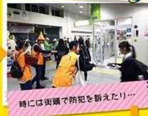
時には街頭で防犯を訴えたり...