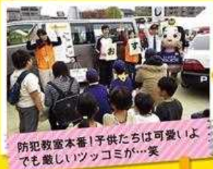
防犯教室本番!子供たちは可愛いよ でも面白いツッコミが...笑