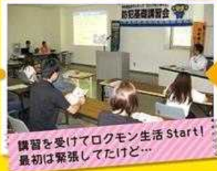
講習を受けてロックモン生活 Start! 最初は緊張してたけど...