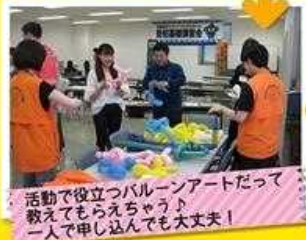
活動で役立つバルーンアートだって 教えてもらえちゃう♪ 一人で申し込んでも大丈夫!